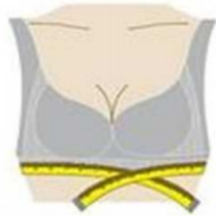
Tour sous la poitrine