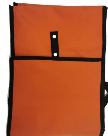
Sac de courses