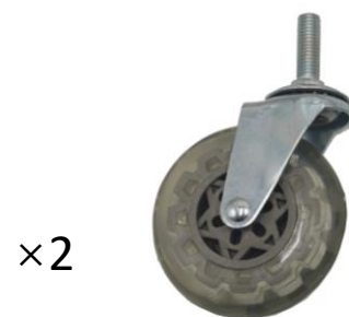
F) Roue universelle