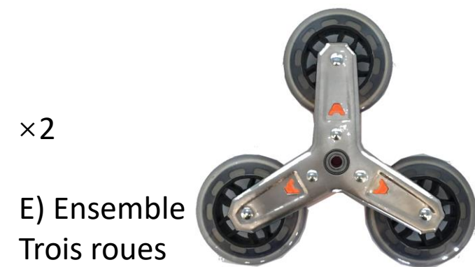
E) Ensemble Trois roues