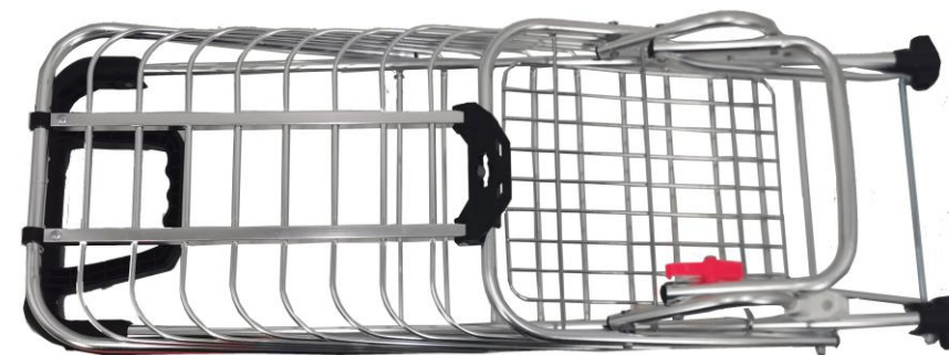
Corps du chariot